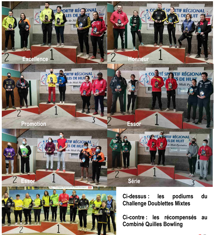
Ci-dessus : les podiums du Challenge Doublettes Mixtes