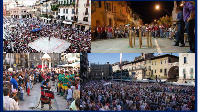
Quelques photos des éditions précédentes.

Le Comité National recherche donc 4 ambassadeurs intéressés à participer à cet évènement et qui assureraient les démonstrations et initiations durant l'ensemble du festival. Tout renseignement peut être obtenu auprès de Vincent au siège.